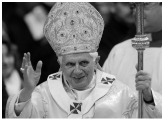
Papa, Benedicto XVI